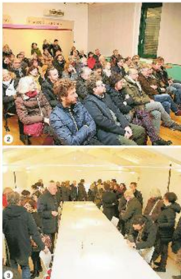
La mostra "20x15", allestita al Museo della Carta di Pietrabugno e visitabile fino al 16 marzo, è realizzata attraverso una serie di bozzetti (foto 1) realizzati da 10 artisti contemporanei toscani sulla carta prodotta a mano dall'Impresa sociale Magnani e usata per anni da artisti come De Chirico o Picasso. Nella foto 2 la conferenza stampa di presentazione, nella 3 i visitatori intorno al tavolo che ospita i bozzetti.